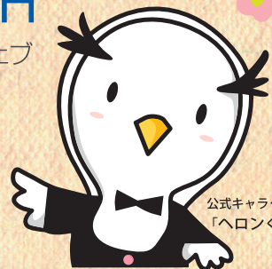
公式キャラクター 「ヘロンくん」

新たに、被扶養配偶者と 18歳以上の被扶養者の方も 「MY HEALTH WEB」をご利用いただけるようになりました。 健診結果も閲覧できます*。 ご利用には初回の利用登録とパスワードの設定が必要です。 ※被保険者は会社提供のシステムをご参照ください。